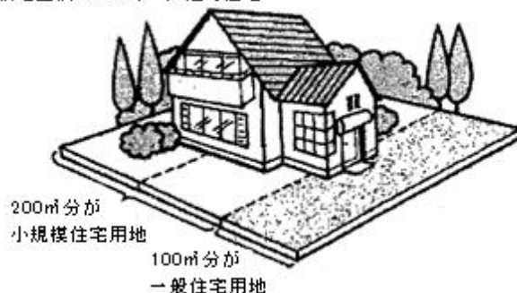
敷地面積300㎡の一戸建て住宅